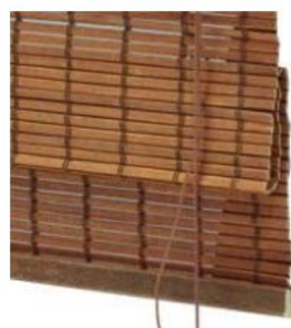
Tip stor roman