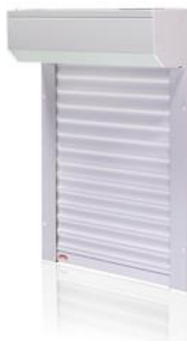
H 40 EXT (lamele 40 mm)