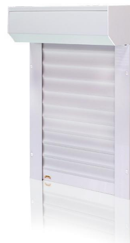
H 52 (lamele 52 mm)