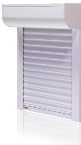
H 39 R (lamele 39 mm)