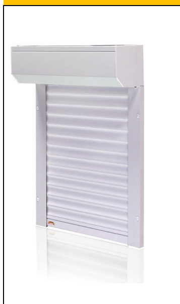
H 39 (lamele de 39 mm)